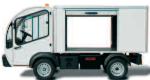
2 ème rideau latéral