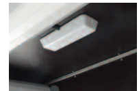
Lumière intérieure dans le fourgon