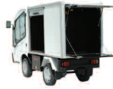
Spécial collecte de linge