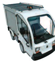
Galerie sur toit